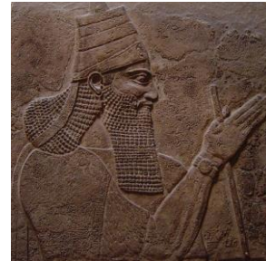
Tiglath-Pileser proveniente de un pedestal existente en el Museo Británico.

T-P 7 tomó el trono en un tiempo cuando Asiria había estado inactivo o incluso declinando por décadas. Un buen número de expertos piensa que T-P fue un usurpador y no el legítimo heredero del trono. 8 Independientemente de cómo asumió el poder, T-P probó ser increíblemente fuerte con líder militar lo mismo que como un organizador de gobierno. En su reinado, el cual duró desde 744 a 727 AC, el cambió el modo en que los reyes hacían la guerra así como también la fisonomía del Imperio de Asiria. T-P fue un imperialista. Él asimiló fácil y rápidamente la clave de estados vasallos semi-independientes dentro del imperio, dividiéndolos en provincias regidos por sus gobernantes asignados. Aun estas provincias, T-P las conservó pequeñas intencionalmente, de este modo los gobernadores no tendrían mucho poder. 9